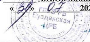
График работы врачей поликлиники на август 2024 г.

УТВЕРЖДАЮ ГЛАВНЫЙ ВРАЧ ГБУЗ РБ Буздякская ЦРБ: А.П.Овчинников « 31 » 08 2024 г.